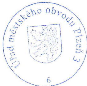
Eva Hubená vedoucí odboru výstavby Úřadu městského obvodu Plzeň 3

Stavba nesmí být zahájena, dokud stavební povolení nenabude právní moci. Stavební povolení pozbývá platnosti, jestliže stavba nebyla zahájena do 2 let ode dne, kdy nabylo právní moci.